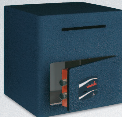
Modell 352 AR